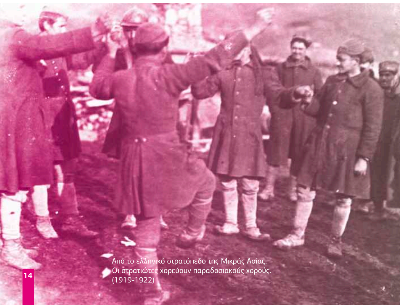
Από το ελληνικό στρατόπεδο της Μικράς Ασίας. Οι στρατιώτες χορεύουν παραδοσιακούς χορούς. (1919-1922)

Λαϊκή έκφραση που ζωντανεύει διαφορετικά από περιοχή σε περιοχή ανάλογα με τα τοπικά ήθη και έθιμα.