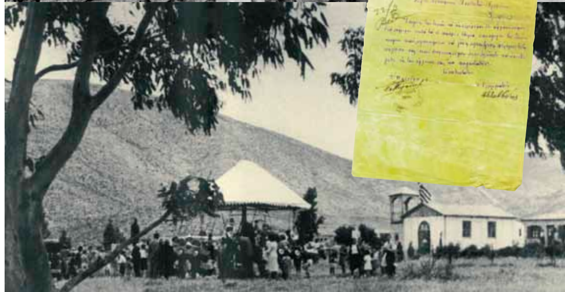
...εικόνες από τη Κυριακή του Θωμά στα Νέα Σούρμενα Αττικής. (1922 -1935)